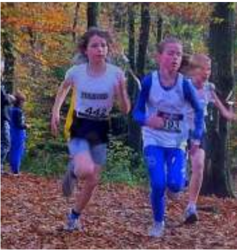
Heuvelop door een echt herfstbos

Iedereen kwam met een tevreden gevoel over de finish.