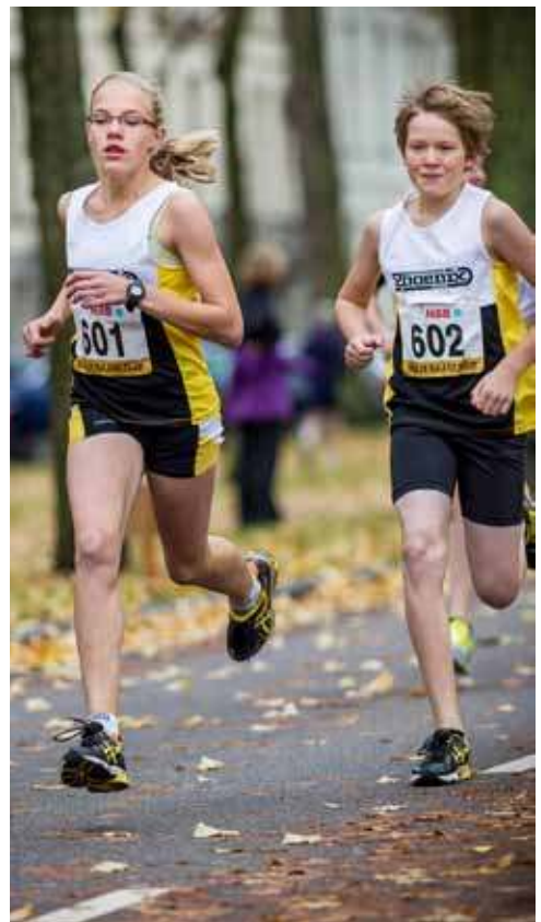
Nida en Juras bij de Maliebaanloop