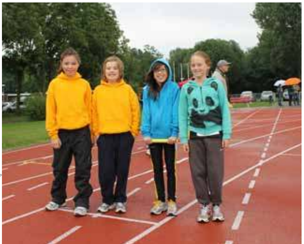
De estafetteploeg van de meisjes pupillen A