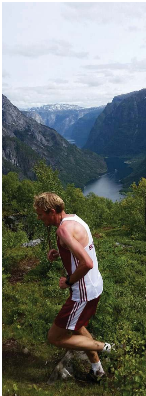
Hoog boven de fjord in de langste helling van Noorwegen.