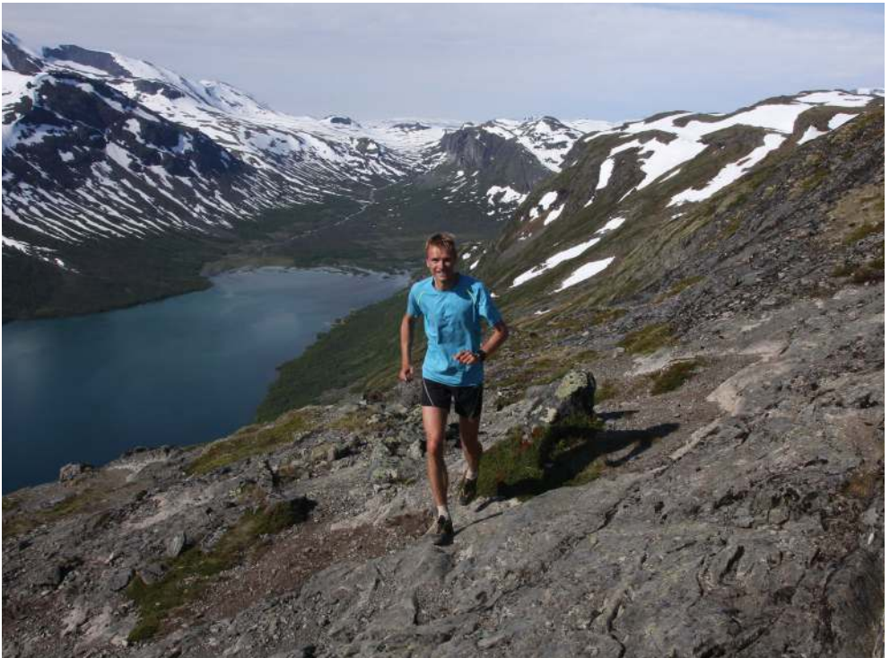
Hoog boven Gjende, het mooiste meer van Noorwegen

Voor mijzelf betekent de Besseggen veel omdat het de eerste trektocht was die ik met mijn vriendinnetje maakte in 1995, en de relatie overleefde ondanks pestweer en slechte kleding. Nu hebben we al jarenlang een berghutje op een uurtje rijden van de Besseggen en zijn we er heel geregeld in de buurt. Ik twijfelde dus niet in 2011: hier moest ik aan meedoen! Zo groen als gras in het berglopen brak ik als oud-800 meter-loper bijna mijn benen in de naar Nederlandse maatstaven erg technische afdaling, en werd ik er flink afgelopen door de lokale skihelden. Maar alles