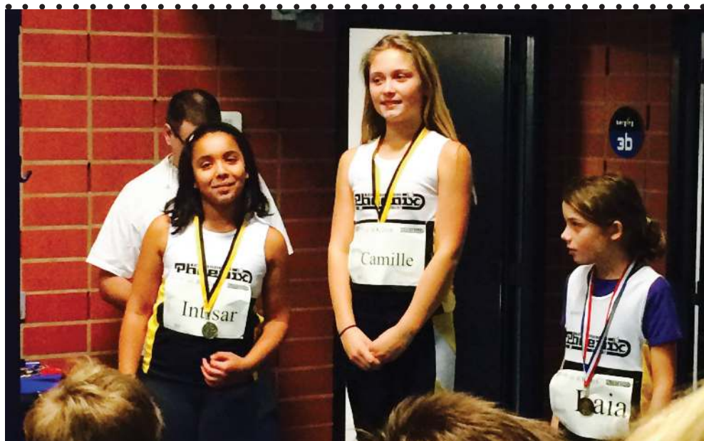
Het podium bij de mpa bij de indoorclubkampioenschappen